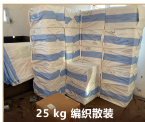
25 kg 编织散装