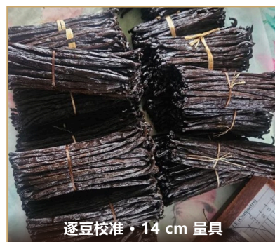
逐豆校准 · 14 cm 量具