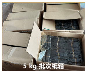
5 kg 批次纸箱