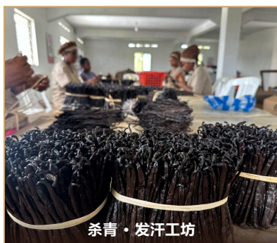
杀青 · 发汗工坊