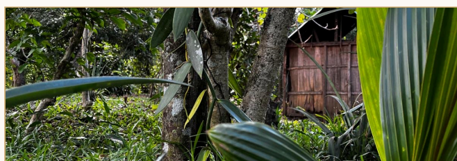
SAVA · D.I.E SARLU 合作种植户