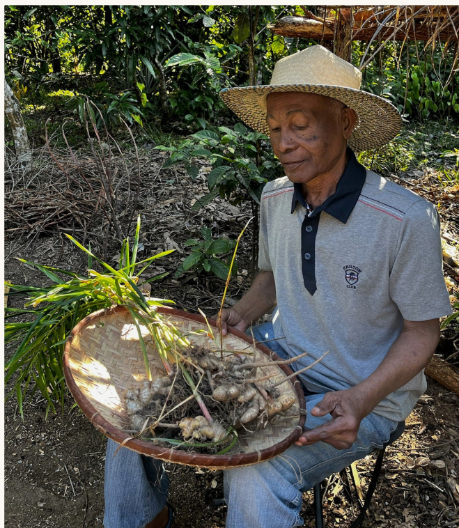
家族传承 · 三代人

法律实体详情 (SIRET、NIF) 见第 13 页 · 银行账户详情见 Proforma 发票。