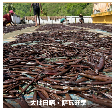
大批日晒 · 萨瓦旺季