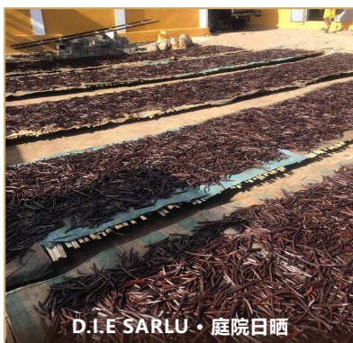
D.I.E SARLU · 庭院日晒

香草藤蔓需 3 年才结豆。我们的合作种植户在 SAVA 区雨林边缘种植，遵循传统人工授粉。