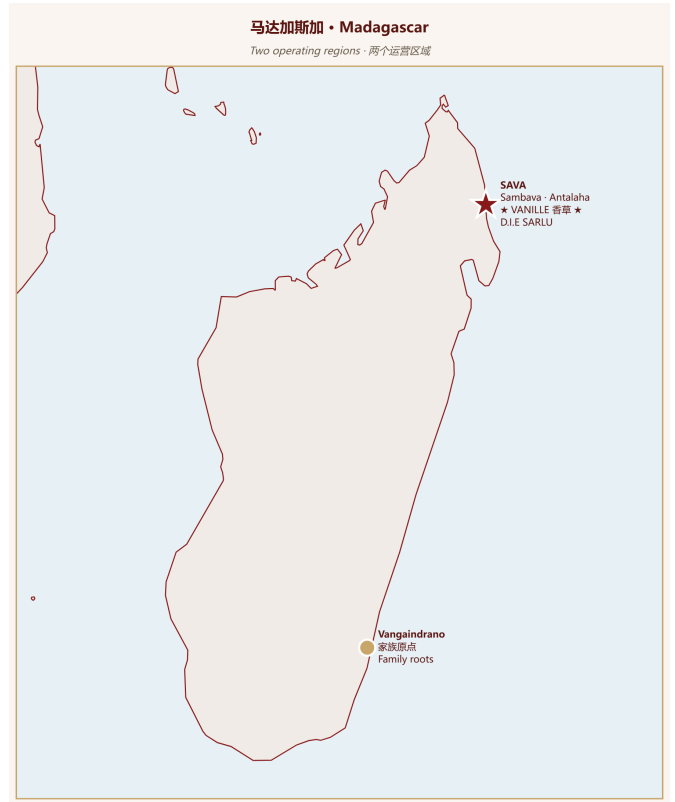
两个运营区域 — 北部 SAVA + 东南部 Vangaindrano