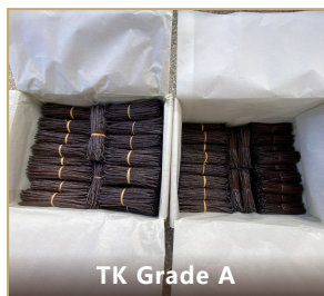
TK Grade A

香兰素 1.4 – 3% · 含水率 30 – 38% · 0% 开裂 (NF ISO 5565-2 cat. I) · 柔韧、油润、有光泽。糕点师签名级别。